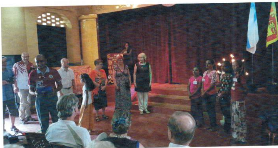
Die Programmgestaltung obliegt den Kindern selbst. Voller Stolz präsentieren sie kleinere Theaterstücke und auch Tänze.